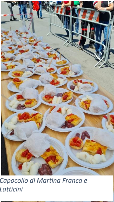
Capocollo di Martina Franca e Latticini

piazza XX settembre, salotto buono della Città di Martina Franca, visita del Centro storico con Roadmap interattiva fornita dalla Pro Loco, della basilica e delle sale nobili del Palazzo Ducale;