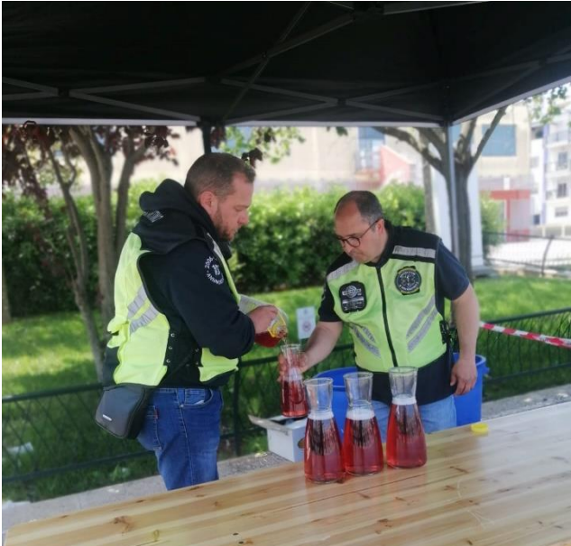
...Non di solo pane...