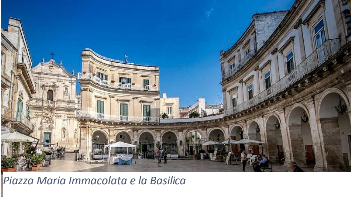
Piazza Maria Immacolata e la Basilica