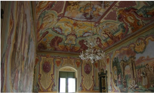
Le Sale Nobili del Palazzo Ducale